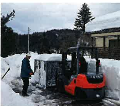
フォークリフトでコンテナを雪室に運び、5列×3段に設置します。