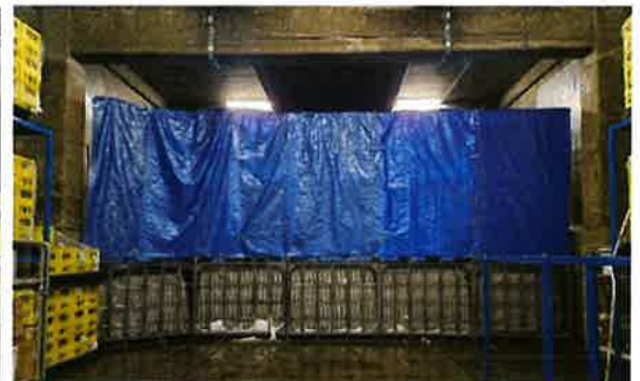
貯蔵庫側から見た雪のコンテナ