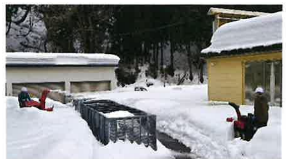
小型除雪機でスチールコンテナに雪を詰めます