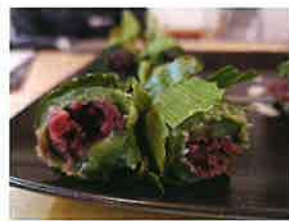
笹は、部会員が収穫し冷凍保存しておいたものを使用しました。