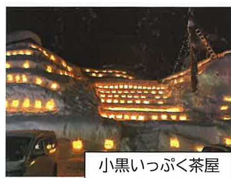
小黒いつぱく茶屋