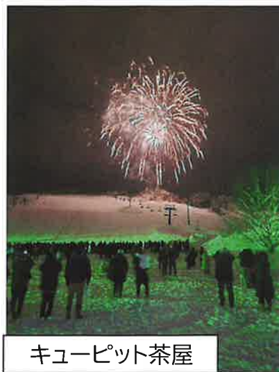
キューピット茶屋